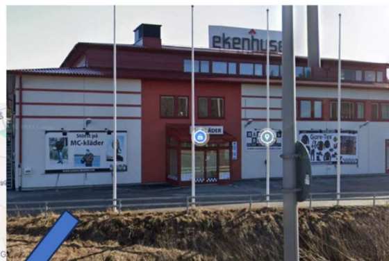
Handelsboden, Kungens Kurva