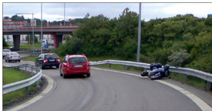
Dieselspill i kurva orsakat att motorcyklist kör omkull och hamnat i vägräcket.

för fordon att starta om tanklocket inte är stängt. Verksamma i åkerinäringen och i busstrafik måste bli medvetna om den höga olycksrisk för medtrafikanter som spill från tung trafik innebär.