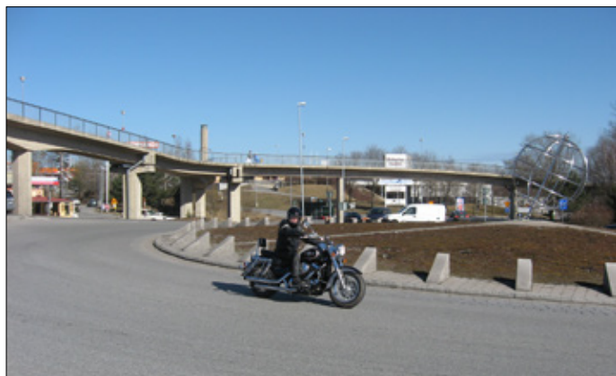
Exempel på utsmyckningar i cirkulationsplatser. Överst en rondell i Falköping. Nedre bilden en rondell i Fittja.