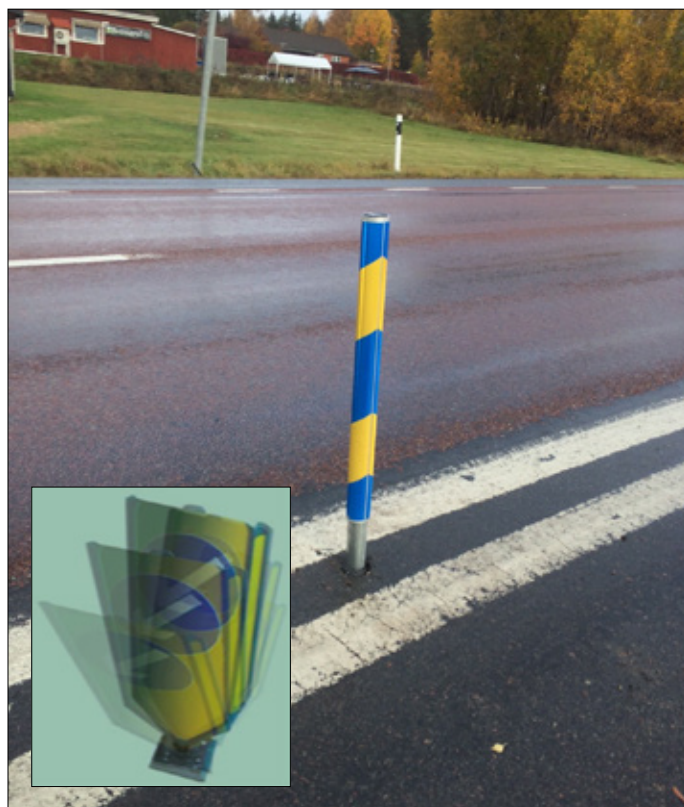
Eftergivliga stolpar är att föredra för alla trafikanter.

Det går också att minska olycksrisken när det gäller stolpar i vägmiljön. Det kan ske genom att samordna skyltning för minimerad förekomst av stolpar, genom att placera stolparna så långt från vägbanan som möjligt, genom att använda stolpar som är eftergivliga även för motorcyklister och genom att inte placera stolpar och andra hinder i ytterkurvor där flest MC-olyckor sker.