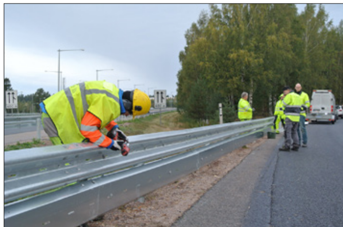
Montering av underglidningsskydd, avfart E4 Gävle.

vägutrustning är därför viktigare för motorcyklister än övriga trafikanter. Räcken med oskyddade stolpar och utstickande delar ökar risken för allvarliga olyckor, medan släta räcken utan fristående ståndare är att föredra. Räcken är det vanligaste krockvåldet i singelolyckor med dödlig utgång bland motorcyklister, följt av träd och stolpar. Alla hinder i vägmiljön gör att risken för allvarliga skador ökar markant vid en olycka. Därför är val av åtgärd viktig, både då det gäller vägens mittremsa och sidoområde. En trafiksäker vägmiljö förutsätter utrymme för undanmanöver, där man kan återta kontroll över ett fordon som får sladd, samt för nöduppställning av havererat fordon, till exempel vid punktering.