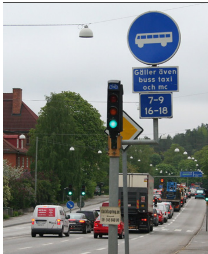
MC-körning i bussfil är en självklar sak om man vill öka säkerhet och framkomlighet.