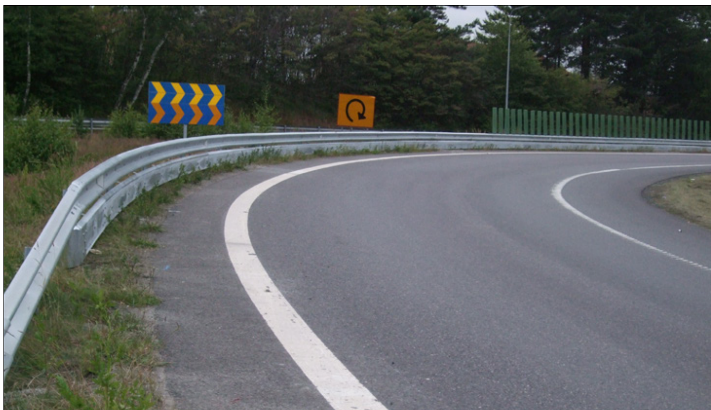
Underglidningsskydd på räcke och varningsskylt för nypande kurva i Trafikplats Ljungarum utanför Jönköping.

Mängder av åtgärder som används för att skapa säkra och attraktiva gatumiljöer innebär att