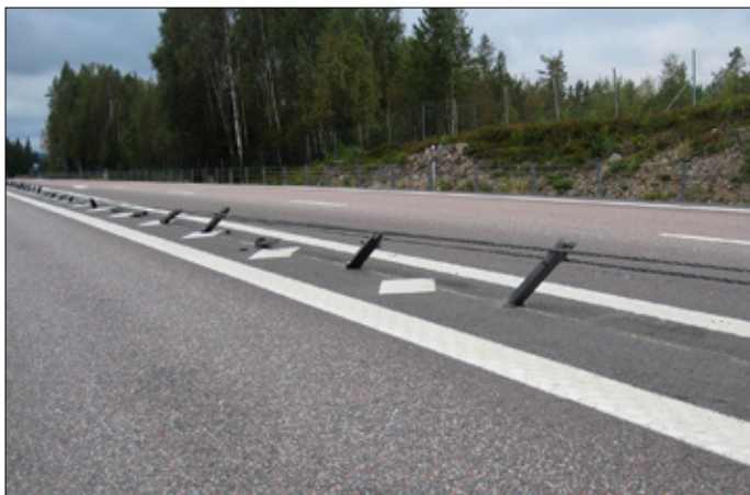
Nedkört vajerräcke efter olycka.