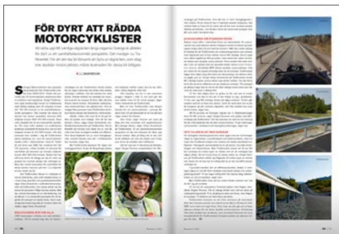
MC-Folket nummer 4-15.