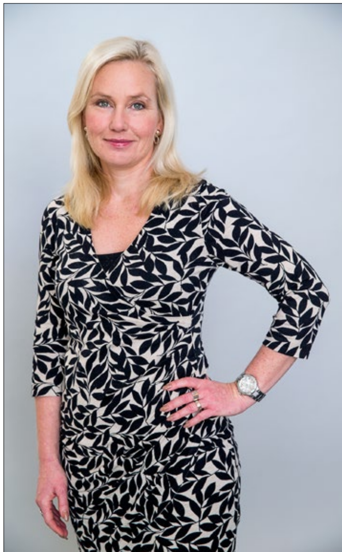
Infrastrukturminister Anna Johansson.