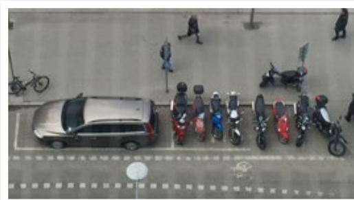
Ovan: En parkering för MC och moped klass I före införandet av P-avgifter. Nedan: Samma parkering efter införandet av P-avgifter.

Under året har Malmö infört Sveriges högsta P-avgift för MC och moped klass I. Det kostar numera 25 kronor/timme att stå i delad ruta. SMC Skåne har uppvakttat samtliga partier och träffat ordförande i Tekniska nämnden. Vid mötet framfördes SMC syn på i synnerhet P-frågor samt även hur trafiksäkerheten generellt kan öka i Malmö. Malmö stads uppfattning är att parkering på gator och torg ska vara besöks-parkering, det vill säga max 2 timmar vilket är grunden för de höga P-kostnaderna.